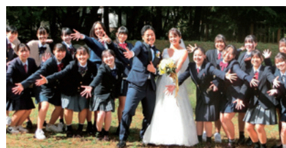
やっちゃん! 赤穂ブライダル